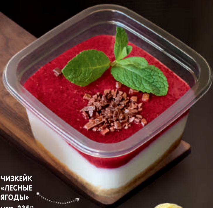
ЧИЗКЕЙК «ЛЕСНЫЕ ЯГОДЫ» 140ГР. 235₽